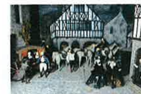
Arrestation de Louis XVI