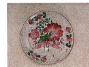
Arts et traditions populaires en Argonne